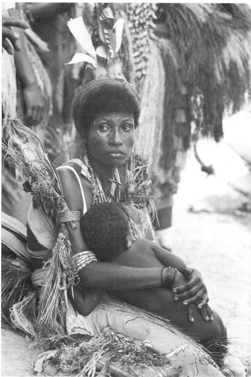
Planșa 1. Mamă și copil din ținuturile litoralului nordic al Noii Guinee (insula Irian).